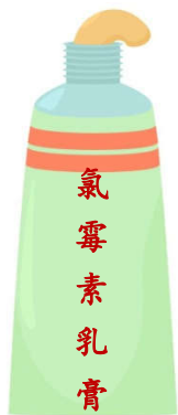
氯 霉 素 乳 膏